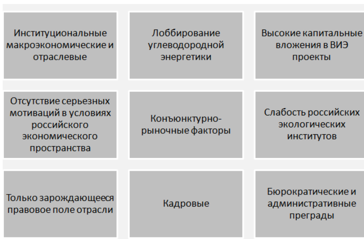
Рисунок 1 - Проблемы отрасли альтернативной энергетики

Кроме перечисленных сложностей развития АИЭ, в отрасли альтернативной энергетики существует и ряд проблем, требующих максимально оперативного решения (рисунок).