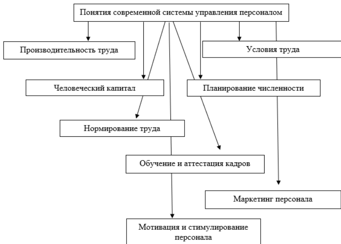
Рисунок 1 – Основные понятия современной системы управления персоналом

На сегодняшний день существует такая система управления персоналом организации, при которой происходит повышение уровня работоспособности сотрудников, привлечения клиентов и извлечения высокого уровня прибыли. К основным понятиям данной системы управления относятся те, что представлены на рисунке 1.