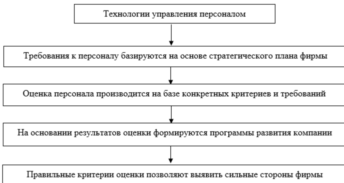
Рисунок 2 – Технологии управления персоналом современной компании

Современный мир – это мир инновационного прогресса, инновационных изменений, к которым относятся автоматизация, робототехника, цифровые технологии. Потребность в использовании и применении современных инновационных технологий в управлении персоналом организации возрастает с каждым годом. Благодаря автоматизации деятельности в сфере управления персоналом возможны: